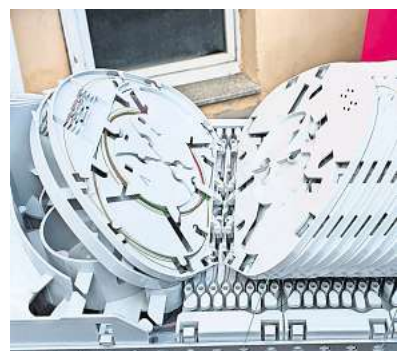
Interessante und seltene Einblicke: So sieht das Innere einer Glasfaser-Muffe aus.