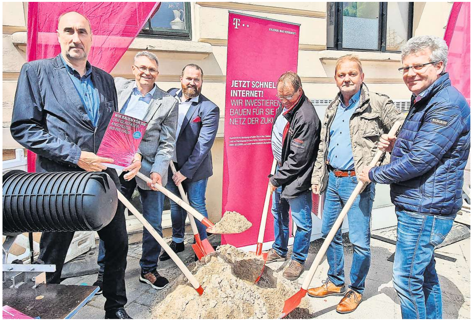
Startschuss für den Glasfaser-Ausbau in Stralsund mit Vertretern von Telekom und den beiden Wohnungsgenossenschaften: 22 750 Haushalte sollen bis 2024 ans Netz angeschlossen werden.