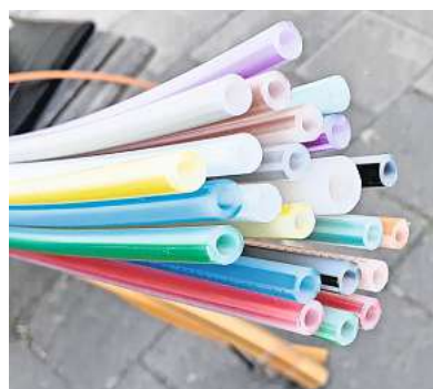
Für jede Wohnung wird ein Röhrchen verlegt, in dem sich die Glasfasern befinden.